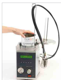
Dispenser resina con vano porta barattolo da 1 kg