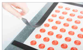
Due vassoi di serie completi di strisce magnetiche per bloccare il materiale