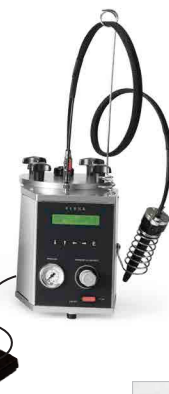
Temporizzatore multifunzione che memorizza i parametri di tempo e dosatura della resina specifica per ogni lavoro (Advanced System)