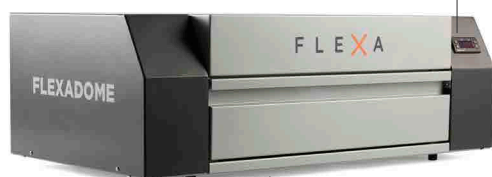
Forno a lampade UV a lunga durata