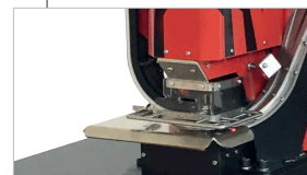
Superficie di scorrimento del materiale in acciaio inox