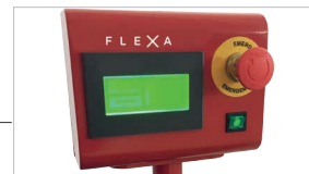
Pannello di controllo touch facile da usare