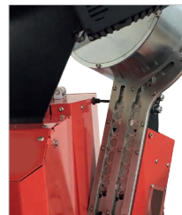
Doppia corsia di discesa per la distribuzione delle rondelle