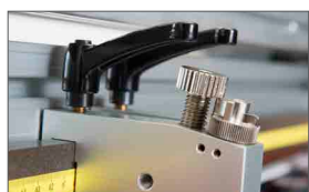
Vite di registro pressione della lama