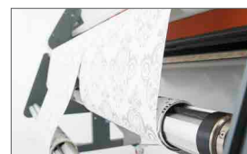
Sistema di riavvolgimento anteriore: riavvolge la bobina tagliata fino a 3 bobine più piccole (optional)