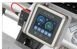
Pannello di controllo per l'allineamento verticale automatico