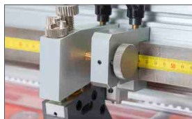
Regolazione micrometrica della posizione dei coltelli (fornita di serie)