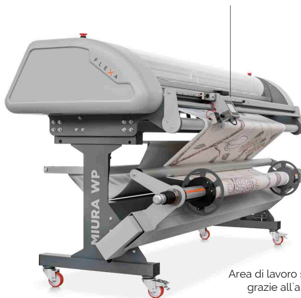
Area di lavoro sempre pulita grazie all'ampia sacca di raccolta sfridi