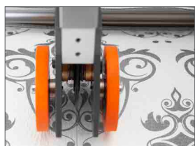
Coltello longitudinale a lama rotante singola con cuscinetto (lama doppia optional)