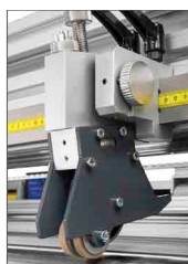
Coltello compatto longitudinale a lama rotante, singolo o doppio (optional)